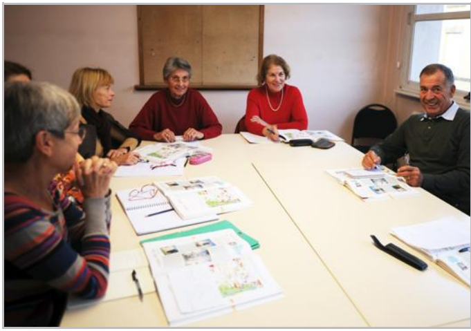
Le mercredi, les germanistes avancés se retrouvent en fin de journée à la salle interjeunes.

Pour tous renseignements sur les cours, qui ont lieu le soir en semaine dans les locaux de la salle interjeunes, rue Charlet à Epinal, il convient de contacter le président au 03 29 33 22 28.