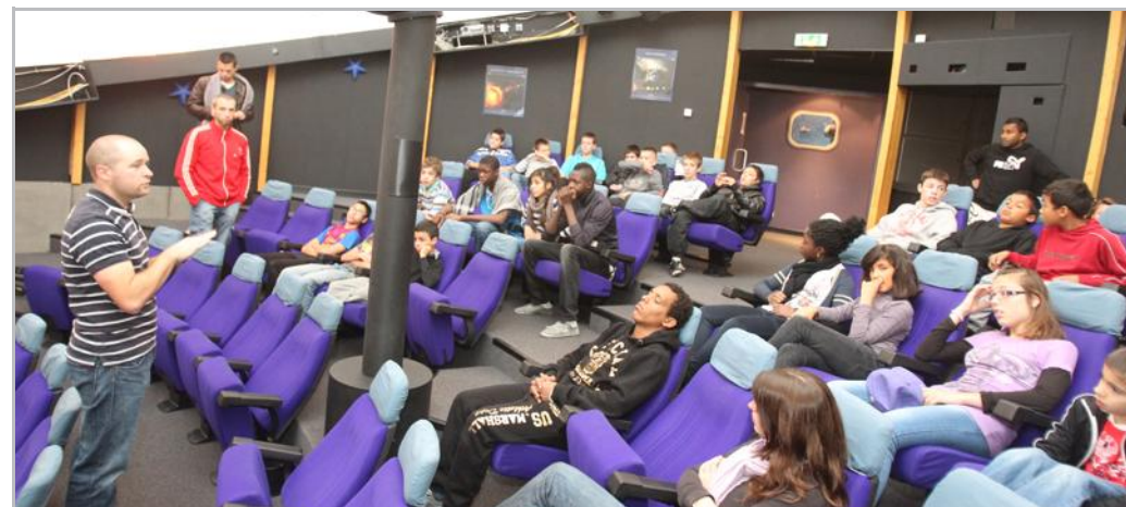
Les jeunes ayant participé à ce séjour de trois jours ont, entre autres, découvert le planétarium de la MJC Belle-Etoile.