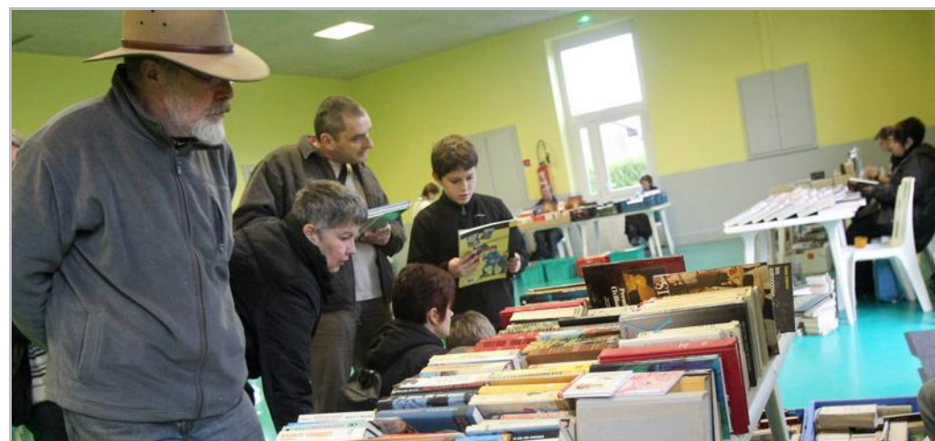
La première bourse aux livres de collection et d'occasion organisée ce week-end à Saint-Laurent a rencontré un succès d'estime qui appelle à de nouvelles éditions.